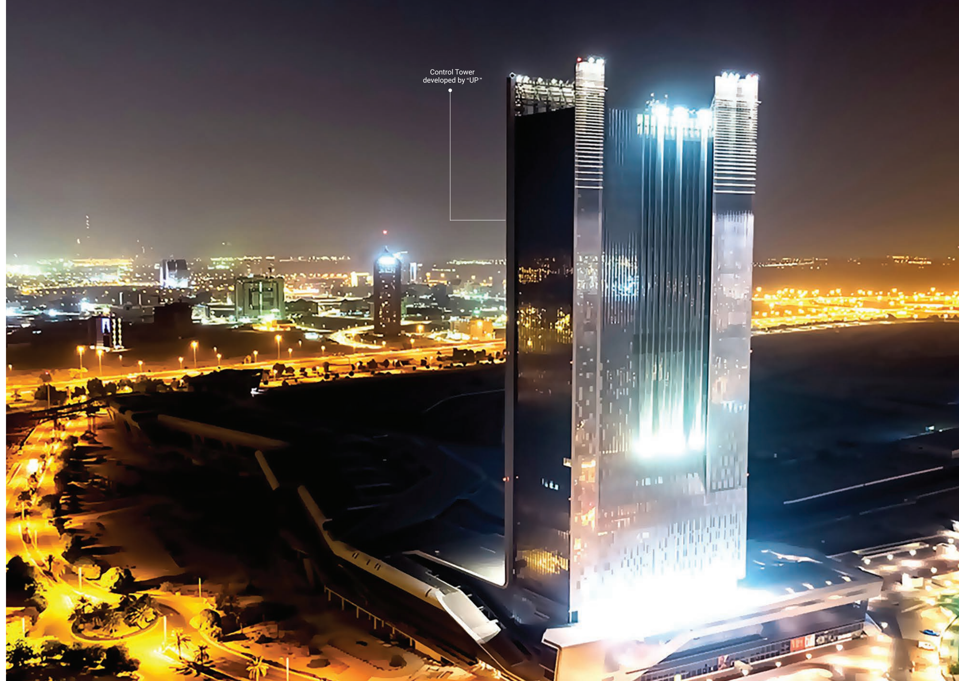
Control Tower developed by "UP"

يتضمن مشروع موتور سيتي عدداً من المرافق التعليمية الرائدة والمرموقة، بالإضافة إلى عدد من المستشفيات، العيادات والصيدليات.